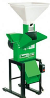
Desintegradores Trapp e vários outros modelos