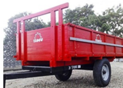
Carreta 3.000 T