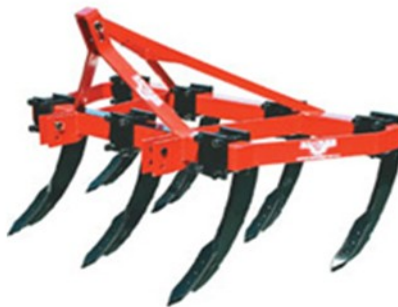
Subsolador 7 garras