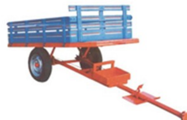
Carreta micro basculante