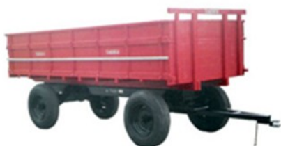
Carreta 6.000T 2 eixos