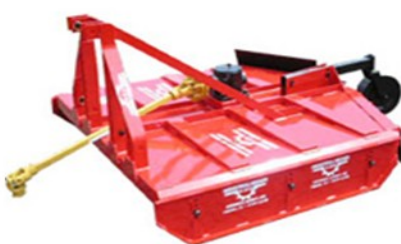
Rocadeira trator Becker