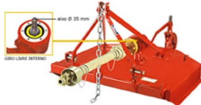
Rocadeira trator Mec-ru