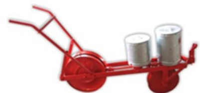
Plantadeira adubadeira tração animal