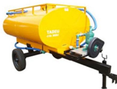
Carreta tanque 3.000l