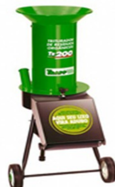
Triturador de folhas