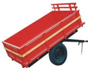
Carreta 2.000 T