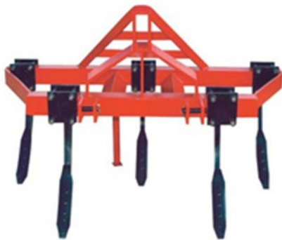
Subsolador 5 garras