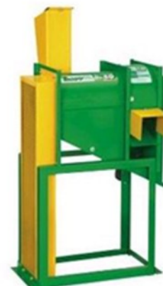
Debulhador de milho