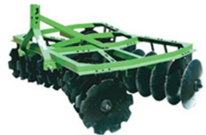
Grade aradora 20 discos