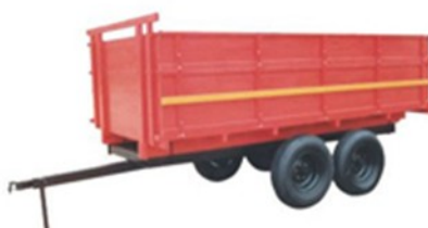
Carreta 6.000T Tandem