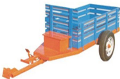
Carreta micro fixa