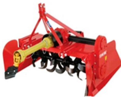
Canteirador ERP Mec-ru 1,50M